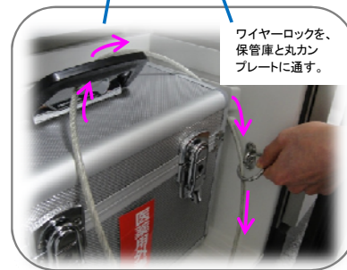
ワイヤーロックを、保管庫と丸カンプレートに通す。